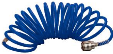
Long tuyau d'air longueur 4mètres Capacité : jusqu'à 170PSI