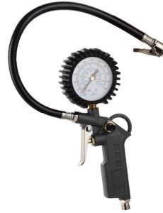
Pistolet de gonflage depneu Capacité : 0~150PSI