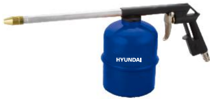
Pistolet de nettoyage Pression d'air: 30~55PSI Air continu: 3.5CFM@30PSI