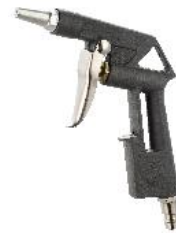
Soufflette Pression d'air: 45~75PSI Air continu: 5CFM@40PSI